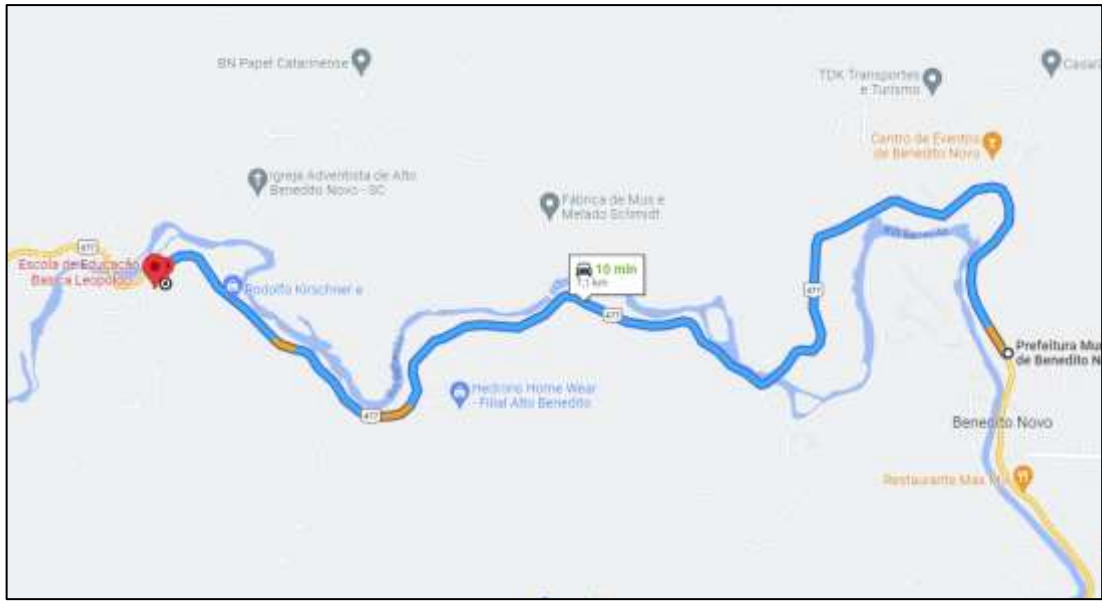
MAPA 3 LOCALIZAÇÃO DA EM ALTO BENEDITO NOVO

Link para consulta do local: Clique aqui.