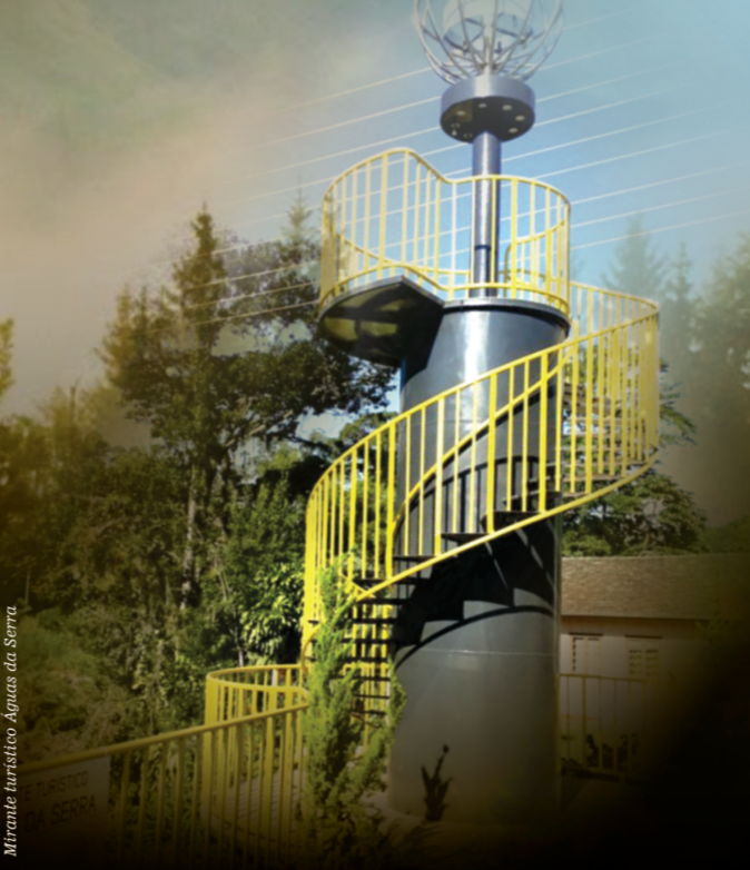
Mirante Paratiro Águas da Serra

Conheça a usina hidrelétrica CEESAM/PCH ABN 1 a maior usina da CEESAM (Cooperativa Geradora de Energia Elétrica e Desenvolvimento de Santa Maria). Está PCH juntamente com as outras duas, PCH Alto Benedito Novo e PCH Santa Maria, faz da CEESAM a maior Cooperativa Geradora de Energia Elétrica de Santa Catarina.