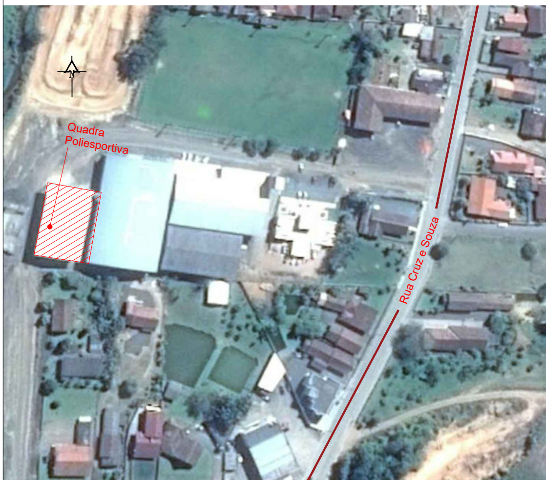
Coordenadas UTM: 662496.18 m E e 7037712.98 m S